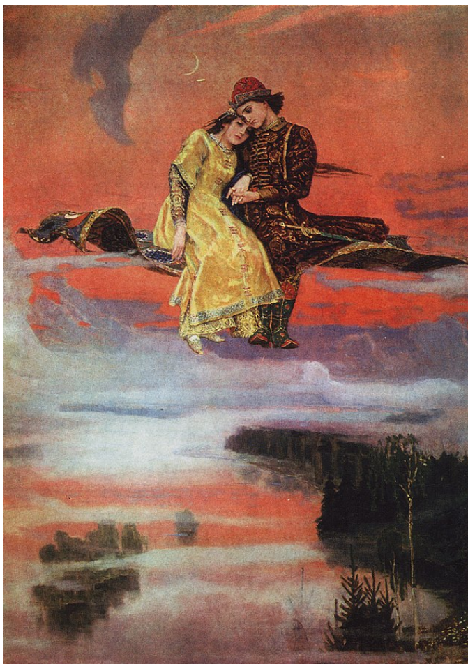
Dieses orientalistische Gemälde von Viktor Michailowitsch Wasnezow, zwischen 1919 und 1926 entstanden, heißt „Ковёр-самолет“, „Fliegender Teppich“ und demonstriert das radikale Schwanken westlicher Islambilder. Wahrscheinlich entstammt die Vorstellung eines fliegenden Teppichs daher, dass die in Kuriositätenkabinetten und Sammlungen eingegangenen Exemplare eines Teppichs mit Kompass o.ä. zu einer solchen Annahme verleiteten. Der diente allerdings nicht zur Orientierung im Fluge, sondern bei der Ausrichtung beim Gebet Richtung Mekka. Bei „Tausendundeiner Nacht“ tauchen sie erst in einigen Übersetzungen und Adaptionen auf.

Im Hintergrund unserer Auseinandersetzung mit dem Thema standen auch die immer deutlicher zu Tage tretenden Berührungspunkte zwischen der aktuellen Diskussion und der Stimmungs- und Argumentationslage kurz vor und während der Zeit des Nationalsozialismus. Damals stellte man alles Jüdische und Kommunistische unter Generalverdacht – wie heute alles „Islamische“. Damals wie heute kursierten jede Menge falsche Informationen, bössartige Unterstellungen, Halbwahrheiten. Damals wie heute wurde eine vielfältige und faszinierende religiöse Tradition in Bausch und Bogen diffamiert. Damals wie heute wurde „argumentieren“ viele hysterisch mit pseudowissenschaftlichen Gedanken und wittern überall Verschwörungen. Unser Eindruck ist: Viele Menschen haben schlichtweg nicht genug aus unserer Geschichte gelernt.