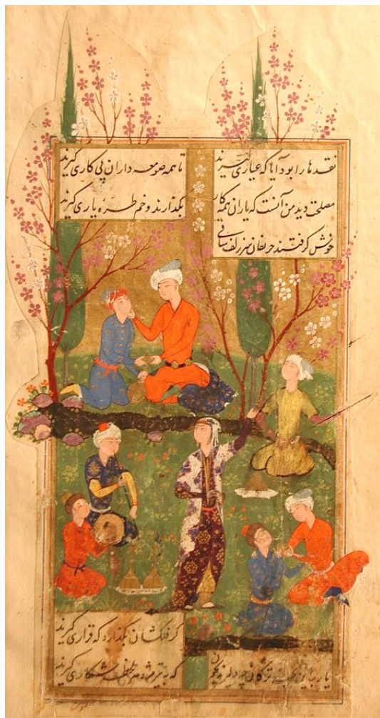
Der Diwan des Hafiz, Manuskript von 1585.

Eine interessante Beobachtung ist für mich, dass es an einigen Stellen durchaus die Andeutung einer Art Bruch in der islamischen Welt gibt: