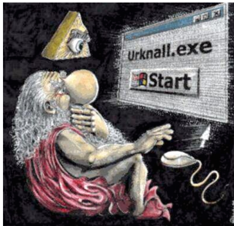
In gewisser Weise veranschaulicht diese Karikatur einige der im Artikel angesprochenen Probleme. Die Autorschaft des Bildes ist unbekannt. Ein Klick auf das Bild führt auf die Webseite von Peter H. Michalicka zum Begriff “Metaphysik” als einen der Fundorte der Karikatur.

Der Zoologe und Verhaltensforscher Frans de Waal fragt “Ist militanter Atheismus eine Religion geworden?” und fordert im Anschluss einen neuen Humanismus “unter Primaten” ( Salon vom 25. März ). Die Probleme “weiter” Religionsbegriffe wurden bereits thematisiert, genauso wie die Schwierigkeiten “traditioneller” Religionskonzepte. Gibt es vielleicht eine philosophische Möglichkeit, etwas Klarheit in die Diskussion zu bringen? Möchte man “Religionen” in einem logischen Kalkül näher bestimmen, bietet sich an – erst einmal unter Ausschluss solcher Bestimmungen, welche ontologisch ein wie auch immer geartetes (“religiöses”) Sein (höherer Wesen oder spezieller Erfahrungen) voraussetzen, oder “Religion” im Singular als z.B. ethisches Prinzip deuten –, diejenige Differenz ins Auge zu fassen, welche auch für entsprechende historische Auseinandersetzungen seit der Aufklärung prägend wurde: Demnach sind “Religionen” zunächst eine Form der (potenziellen) Vergemeinschaftung unter Einbezug bzw. auf Basis von gemeinsamen metaphysischen Urteilen.