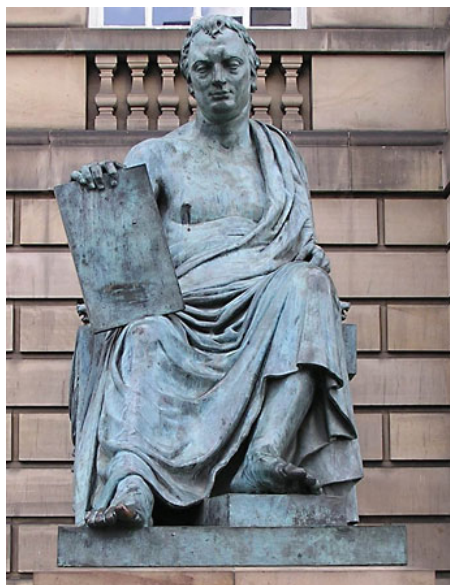
Das Foto zeigt eine David-Hume-Statue in Edinburgh. Nach

Allerdings darf man auch nicht dem Kurzschluss verfallen, "Wissenschaft" wäre in erwähnten Konflikten das Gegenüber (das Andere) der Religion(en). Schon eher sinnvoll ist die Wahrnehmung, dass es gerade eine bestimmte materialistische Ontologie ist, welche sich gegenüber den Religionen positioniert bzw. diese als Sammelbegriff für überhaupt andere abweichende Ontologien etabliert (und die erwähnten Konflikte antreibt, forciert oder initialisiert). Sicherlich lässt sich diese Beobachtung spezifizieren, dass es sich mindestens in bestimmten Weltgegenden um eine hegemoniale Position handelt, wenn man materialistische Ontologien vertritt.