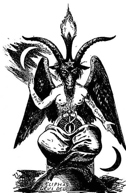
Berühmt-berüchtigt ist diese Abbildung des "Baphomet" aus Éliphas Lévis "Dogme et Rituel de la Haute Magie", 1854. Die Figur ist angelehnt an den historischen Vorwurf im Prozess gegen die Templer im 14. Jahrhundert, einen Götzen entsprechenden Namens verehrt zu haben. Historiker sehen in dem Namen eine Verballhornung des islamischen Propheten Muhammad. Für den abendländischen Okkultismus nach Éliphas Lévi wurde der Baphomet zum wichtigen Symbol. Der Okkultist Aleister Crowley sah sich zudem als Reinkarnation Lévis.

Ihre Arbeit beschäftigt sich insgesamt mit Sozialismus und Okkultismus. Welche Traditionen (von Initiationsgesellschaften oder 'hermetischen' Autoren) wurden in den Sozialismen fruchtbar gemacht oder später aus diesen heraus neu begründet – ohne den vorherigen politischen Anspruch?