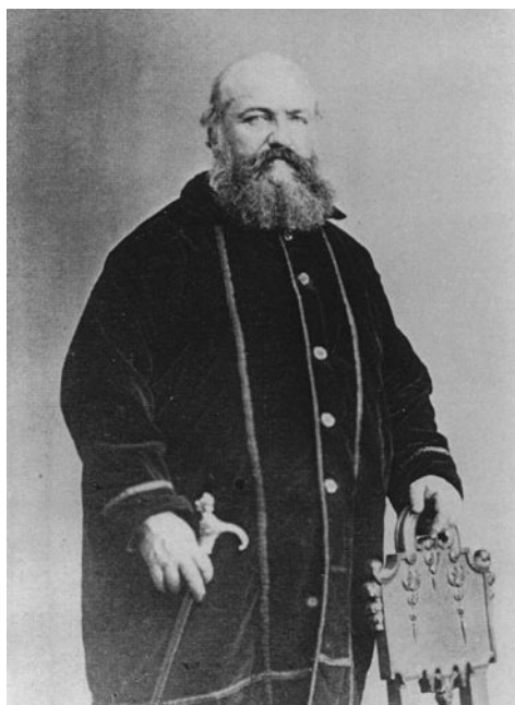
Éliphas Lévi alias Alphonse-Louis Constant wird oft nur als "Diakon, Schriftsteller und Okkultist" erinnert (z.B. Wikipedia). Seine sozialistischen Schriften werden regelmäßig übergangen.

Nach der Zersplitterung des Saint-Simonismus übernahmen die Fourieristen ihre Position als einflussreichste Schule. Es kam zu einer komplexen Ausdifferenzierung der französischen Sozialismen, die sich beispielsweise um religiös ausgerichtete Denker wie Pierre Leroux, den katholischen Sozialisten Philippe Buchez, den christlichen Kommunisten Etienne Cabet, die schismatische Kirche des Abbé Châtel oder Constantin Pecqueur scharten. Hinzu kommt eine große Masse an kleineren Figuren wie Flora Tristan, eine der ersten Feministinnen, oder Alphonse-Louis Constant, um den sich meine Dissertation dreht.