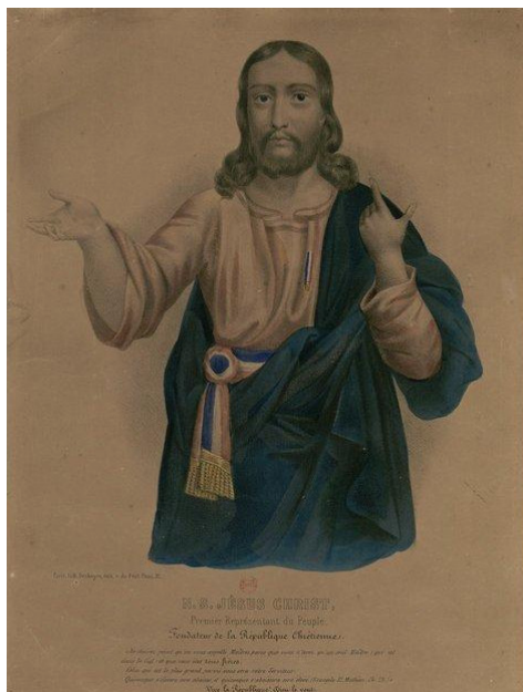
Jesus Christus als Erster Volksrepräsentant mit den Insignien der Französischen Revolution, Mausclick führt zur Ansicht bei Gallica (vgl. "[...] nach Saint-Simon und in seinem Namen werden wir verkünden, dass die Menschheit eine religiöse Zukunft hat, dass die Religion der Zukunft viel größer, viel mächtiger ist als alle Religionen der Vergangenheit, dass sie wie alle vorangegangenen die Synthese aller Vorstellungen der Menschheit und zudem aller ihrer Daseinsarten sein wird, dass sie nicht nur die politische Ordnung beherrschen wird, sondern dass die politische Ordnung in ihrer Gesamtheit eine religiöse Einrichtung sein wird [...]"; Doctrine de Saint-Simon I, Paris 1830, S. 334.)

Nun sind diese frühen Sozialismen den LeserInnen vermutlich kaum bekannt. Vielleicht könnte man für unsere LeserInnen ein bis zwei Autoren kurz umreißen, damit eine ungefähre Vorstellung das weitere Verständnis erleichtert?