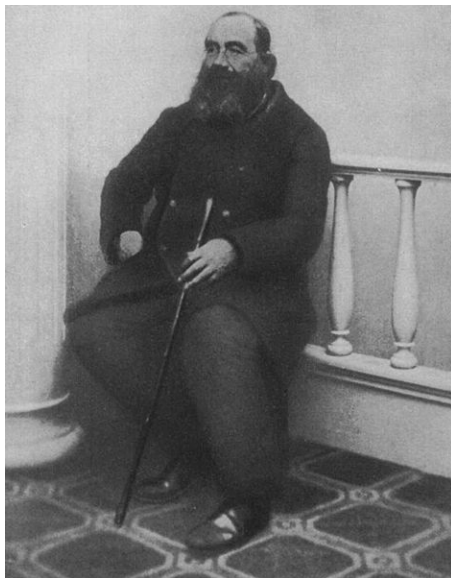
Eine Abbildung des Begründers aus den Briefen Lorbers, erschienen im Neu Salems Verlag 1931.

Ein anderer Fall ist die Lorber-Bewegung (Jakob Lorber lebte von 1800-1868 und empfing das "Große Evangelium Johannes" u.a.). Wie der Quietismus in Frankreich des 17. Jahrhunderts ist diese sich als überkonfessionell verstehende Gemeinschaft in einem katholischen Milieu entstanden. Trotz des Anerkennens ähnlicher Bewegungen quer durch alle Religionen verstehen die Lorberianer sich als Christen. Im Gegensatz zu den Mormonen besteht kein besonderer Bezug zur Reformation oder zu einem Urchristentum, vielmehr wird "einfach" eine Nicht-Abgeschlossenheit der Offenbarung behauptet. Die Anhänger sind auch häufig noch Mitglied in ihrer Herkunftskirche und sehen darinnen keinen Widerspruch, sondern betonen vielmehr ihre Rolle als gutes Exempel.