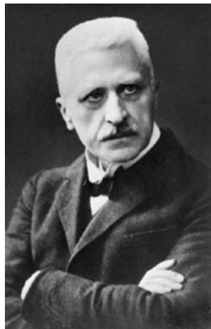
Zeitgenössische Aufnahme des systematischen Theologen und Religionsphilosophen Rudolf Otto von 1925. Sein Werk beeinflusste stark die frühe Religionswissenschaft.

Es soll an dieser Stelle nicht darum gehen, eine solche Auswahl als repräsentativ zu verstehen, noch darum, etwa Jung und Otto gegeneinander auszuspielen. Man könnte höchstens – und dies auch nur als Randbemerkung – eine gewisse Strukturparallele des Werkens und Wirkens behaupten, die jedesmal auch teilweise auf einer Art Missverständnis zu beruhen scheint. Denn beide Autoren versuchten, einen wissenschaftlichen Zugang zu einem Thema zu finden, nämlich Otto zum „Heiligen“ als grundlegendem Terminus einer Wissenschaft der Religionen und Jung zum „Unbewussten“ als einem wichtigen Begriff in seiner sogenannten „Tiefenpsychologie“, – und beide Autoren scheinen auf ihre je eigene Art eher zu (Religions-)Stiftern von dem geworden zu sein, was zu erforschen beabsichtigt gewesen war.