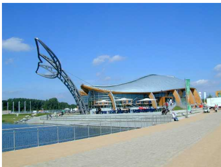
Die Deutsche Evangelische Allianz versteht sich als evangelikales Netzwerk bzw. evangelisch-reformatorisch gesinnter Christen. 350 Werke stehen ihr nahe (d.h. verwenden potenziell das DEA-Spendenzertifikat). Der eigentliche Verein hat nur um die fünfzig Mitglieder. Nach eigenen Angaben spreche die Allianz allerdings für 1,3 Mio. Christen. Sie beteiligte sich gemeinsam mit World Vision Deutschland und dem CVJM-Gesamtverband am Projekt Pavillon der Hoffnung auf der Expo 2000.

Zum Christentum ist zu sagen, dass sich die Autoren mehrheitlich christlich positionieren. Liberale Tendenzen in den Kirchen werden jedoch scharf kritisiert. Im Wesentlichen betrachtet die JF Gruppen und Einzelpersonen innerhalb der Kirchen positiv, welche sich an deren rechten Rändern positionieren. Zum Teil existieren Beziehungen zur „Deutschen Evangelischen Allianz“ (DEA) und deren Nachrichtendienst idea. In der Arbeit wurde deutlich, dass die entsprechenden Autoren eine „starke“ christliche Identität als Schutz gegen das „Andere“ in Form des Islam und muslimischer Einwanderer sehen. Interessant ist weiter, dass eine Thematisierung des Islam erst seit Mitte der 90er Jahre stattfindet und der Islam anfangs eher positiv betrachtet wurde. Dies geschah in der Hinsicht, dass der Islam Werte besitzen würde, die der Westen verloren hätte.