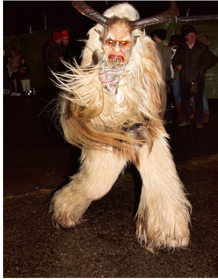
Die Tradition der Perchtenläufe (hier 2008 in Salzburg) soll zwar bereits im 16. Jh. vorübergehend existiert haben, zurück gehen sie allerdings auf das 19. Jahrhundert.