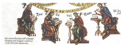
Detail einer Darstellung der sieben freien Künste aus dem Hortus deliciarum der Äbtissin Herrad von Landsberg (um 1180). Jenseits des Kreises der (anerkannten) Wissenschaften sind die Dichter und Magier, die den Einflüsterungen der Teufel (am Ohr) lauschen.

Die Passage ist deutlich als Dichter-Exkurs gekennzeichnet (erst danach wird die eigentliche "Rede" fortgesprochen). Dieser ist offenbar nötig, um die Rolle des "heidnischen" Gottes Apoll für sein christliches Publikum zu erläutern, dem Achill zuvor in Delphi ein Opfer brachte, um seine Hilfe zu erbitten. Dahinter steht die Lehre von den dämonischen Einflüsterungen des Teufels, die als Hirngespinnste, Halbwahrheiten und Sinnestäuschungen begriffen werden. Die Differenz zu einem aufgeklärten Standpunkt besteht eigentlich nur darin, dass ein Wirken des Teufels in diesen Irrtumsgründen angenommen wird.