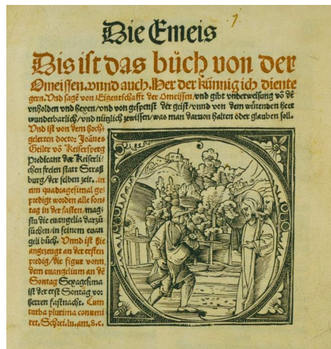
Die Emeis // Sis ist das bûch von der // Omeissen, vnnd auch. Her der künig ich diente // gern, Vnd sagē von Eigentsohafft der Omeissen/ vnd gibt vnderveisung vō dē // vnholden vnd hexen/ vnd von gespenst der geist/ vnnd von dem wuetenden heer // wunderbarlich/ vnd nützlich zewissen/ was man daruon halten oder glauben soll. // Vnd ist von dem hooch=||gelerten doctor Joānes // Geiler vō Kaysersperg // Predicant der Keiserl=||chen freien statt Straß||burg ... // ge=||predigt worden alle son=||tag in der fasten ... // Straßburg : Grüninger, Johann, 1516.

Mit Verweis auf manche der erwähnten Belege, den "so getän gespüc" der "warsagerinne" und "nahtfrouwen" (Nachtfrauen, Hexen) in der (vermutlich unechten und eigentlich späteren) 43. Predigt des Berthold von Regensburg (13. Jh.) und Johann Geilers von Kaysersbergs "Emeis" (gedruckt 1516) konsistiert auch das Wörterbuch der Gebrüder Grimm: "erst in den letzten jhh. wurde der ausdruck [Gespenst] recht gewöhnlich".