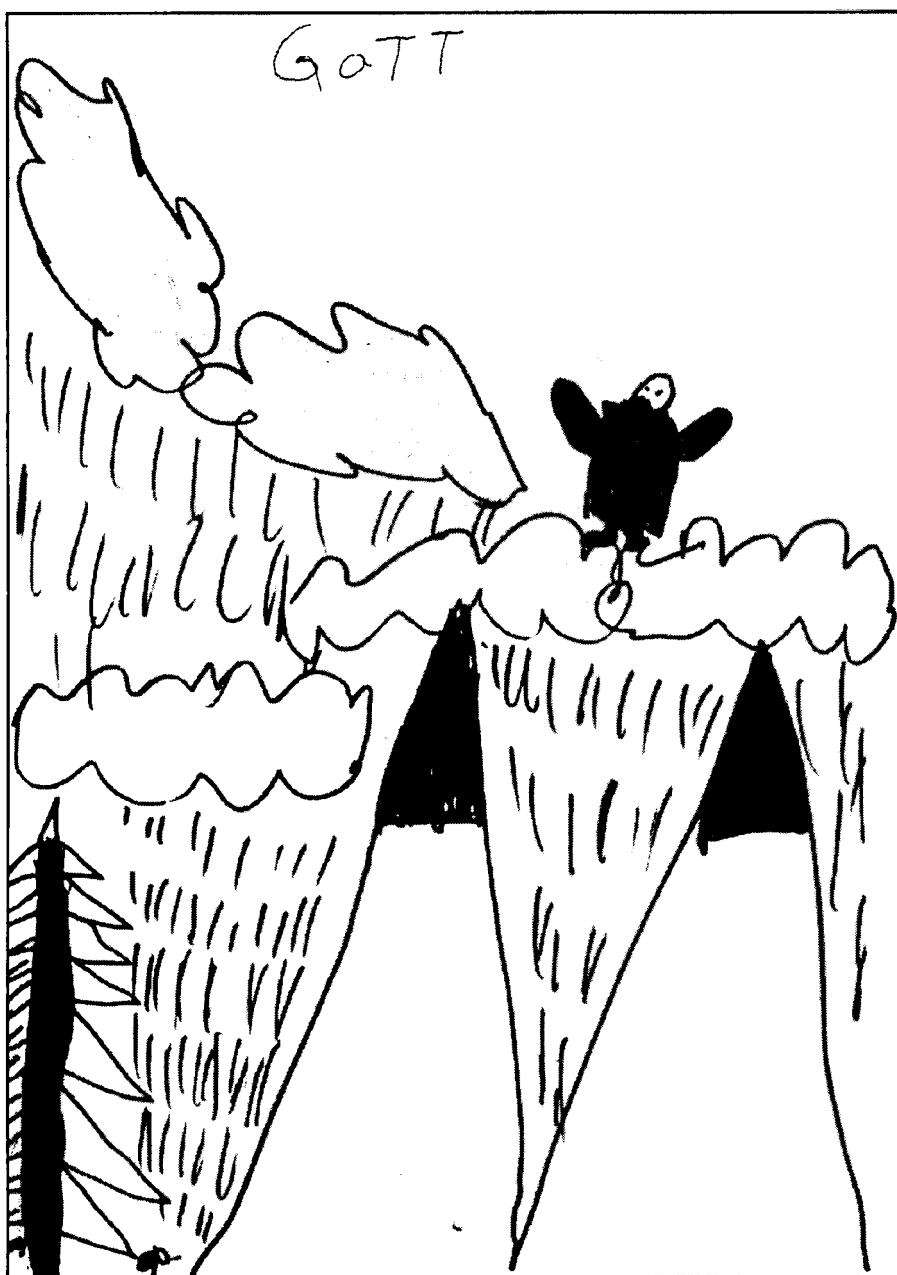
Gott, gezeichnet von Dominik Wiese aus Kaiserslautern

Spätestens jetzt taucht eine theologische Grundfrage auf, die eigentlich von Anfang an auch die Überlegungen zum Theodizee-Problem heimlich bestimmt: Wie kommen wir überhaupt dazu, von Gott zu reden ? Schon in der christologischen Weichenstellung wurden Probleme deutlich, die eine schlichte Übertragung unserer Alltagserfahrung auf Gott verbieten. Gotteserfahrung ist immer interpretierte Alltagserfahrung, interpretiert durch den Blick in der Gott-Perspektive selbst, die, so lautet