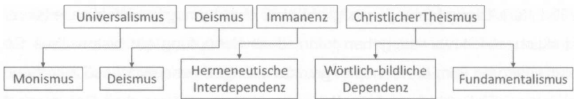
Abbildung 4: Zusammenhang von Weltbilddimension und Schöpfungsmodell

rungsleistung von Schöpfung, mal deren kreative Unterbrechung. Mal werden normale Erfahrungen schlicht nachträglich theologisiert, mal werden neue Erfahrungen darin sprachfähig. Das wird möglich, weil die Modelle zueinander so in Beziehung stehen, dass sie jeweils Wesentliches erkennen, was in anderen Modellen verloren geht (vgl. Büttner/Reis 2010: 254f.). Sie entfalten thematisch die Perspektiven der Weltbilddimensionen, so dass die Schöpfungsmodelle gut in die Weltbildstrukturen eingebettet sind (vgl. Abb. 4).